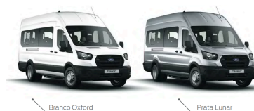
Minibus 17+1 MT